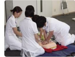
研修・教育システムの様子 BLS研修ではしっかり理論を学べ実技も全員行います。緊急時適切に行動できるよう取り組んでいます。

担当者 連絡先 医療法人堀尾会 法人事務局 総務部 執柄(トリエ) E-mail:saiyou@horio-kai.or.jp TEL 096-381-5190 FAX 096-213-6333