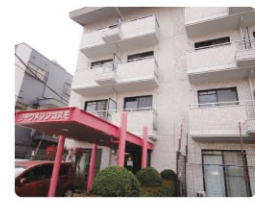
福利厚生の様子 尾ノ上にある職員宿舎「シークメソノコスモ」です。エアコン、IHコンロ、テレビドアホン等完備です。

【研修・教育システム】 《看護部》新人さんは1年間のプリセプター体制をとり、現任教育ではラダー教育体制を基盤に職員の技術レベルに応じたOJTおよび、院内、院外研修を計画的に実施しています。さらに自分自身で将来に向けての目標管理ができるように、師長をはじめ、サポート体制を組み個々のキャリアアップを支援しています。