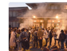
福利厚生の様子 阿蘇温泉病院の新人歓迎バーベキューに当院新人職員も参加し、交流を深めています。

院内研修、院外研修に参加していただき、 また費用支援を含めた資格取得、 進学支援を行っています。