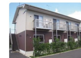
福利厚生の様子 単身者向け職員アパート「エーデルワイス」。

【研修・教育システム】 院内研修・職能団体主催研修参加・学会主催研修参加・各資格取得支援制度あり