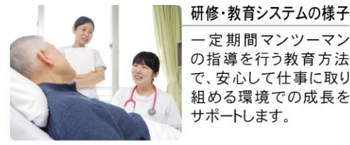
研修・教育システムの様子 一定期間マンツーマンの指導を行う教育方法で、安心して仕事に取り組める環境での成長をサポートします。

担当者連絡先 人事部 採用係 E-mail: jinji@sakurajyuji.jp TEL 096-378-1533 FAX 096-378-1119