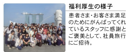
福利厚生の様子 患者さま・お客さま満足のためにがんばってくれているスタッフに感謝とご褒美として、社員旅行にご招待。

初任給 《看護師》月額180,000円/想定年収 3,918,000円(夜勤込) 《准看護師》月額180,000円/想定年収 3,568,000円(夜勤込) 《介護福祉士》月額150,000円/想定年収 2,658,000円(夜勤込) 諸手当 《看護師資格》30,000円 《准看護師》5,000円 《看護師・准看護師》夜勤手当:11,000円/回 《介護福祉士》資格手当:10,000円、夜勤手当:6,000円/回 賞与 《看護師・准看護師》4.5ヵ月 《介護福祉士》3.0ヵ月 勤務時間 【日勤】8:30~17:30 【早出】7:30~16:30 【遅出】10:00~19:00 【夜勤】17:00~9:00 休暇等 有給休暇(初年度10日/半年後付与)、結婚休暇、慶弔休暇、生理休暇、育児休暇